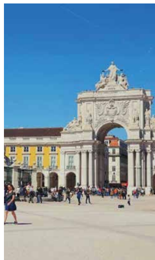
Praça de Comercio, Lissabon