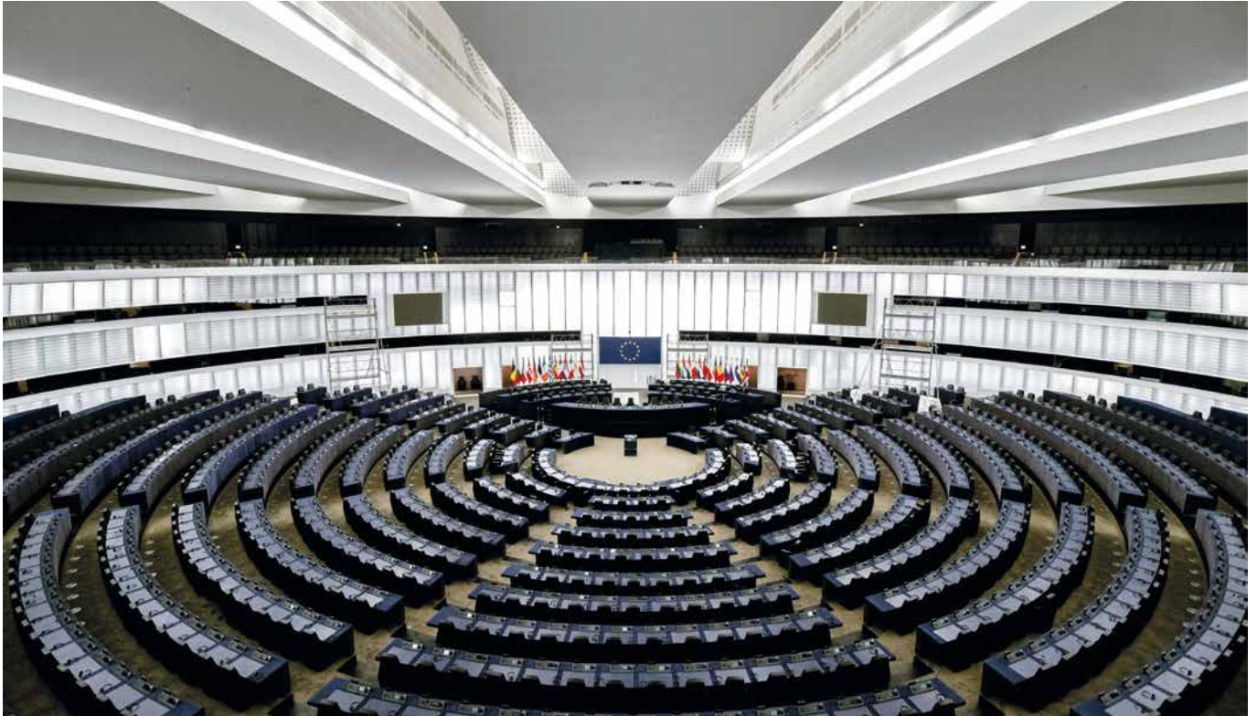
Blick in den Plenarsaal des europäischen Parlaments in Straßburg