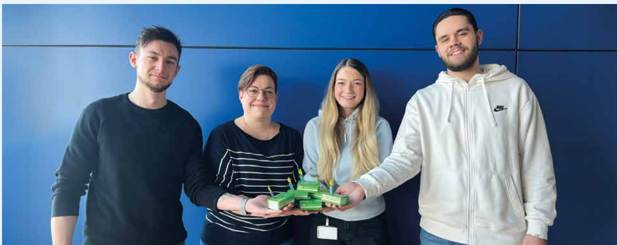
Streck-Mitarbeiterinnen und -Mitarbeiter aus den Nationalen Landverkehren in Freiburg gratulieren herzlich zum ersten Geburtstag von NG.network