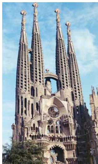
Sagrada Família, Barcelona